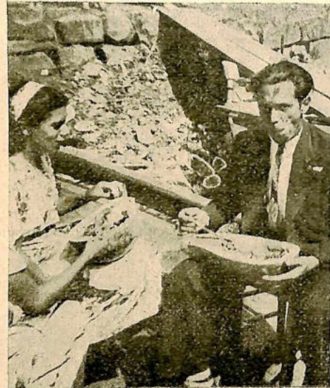
E ASSIM que os grupos pagam seu tributo à tradição da festa. Reparem na maneira de a fazer: sem cerimônia