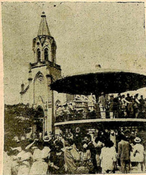
FLAGRANTE da tradicional festa que se realiza desde 80 anos passados. Ao fundo, a Igreja de N. S. dos Navegantes

Ao redor e cercando a praça, uma infinidade de tendas: Churrascaria Sumaré, Tenda das Serraninhas, Churrascaria Tupi, Maria Bonita, Churrascaria São Luís, Carmelito Ingrato, Churrascaria São Nicolau, Barraca Pescador Gaúcho, Tenda Deus Te Ajude, Churrascaria Santa Catarina, Tenda Araribóia, Churrascaria Marujo... Como se vê, muito explicitamente as churrascarias predominam. Havia mais: Tenda