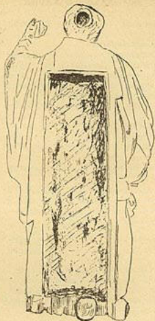
Estátua de São Francisco Xavier, talhada em cedro. Escultura do ciclo missionário conservada no Museu Estadual Júlio de Castilhos, Porto Alegre. Observa-se a grande cavidade dorsal e o diminuto nicho craniano. Na reprodução, para maior visibilidade, sua tampa está colocada ao pé da imagem.

A primeira delas possui a escavação dorsal comum, dos ombros até os pés. Mas, além desta cavidade, apresenta um orifício pequenino, arredondado, na face